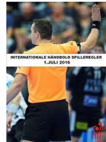
INTERNATIONALE HÅNDBOLD SPILLEREGLER 1. JULI 2016

HÅNDBOLDBANEN Tegning med målangivelser over håndboldbanen